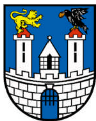
Wappen von Czestochowa